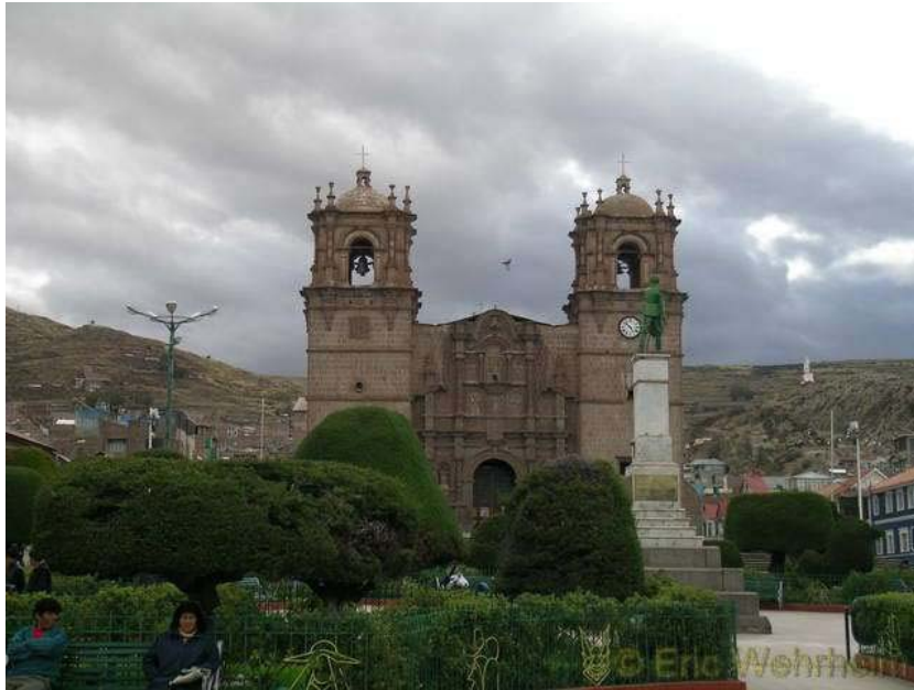
Die Plaza mit Kathedrale in Puno