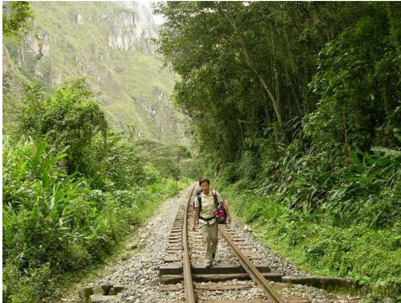
Auf dem Weg nach Machu Picchu