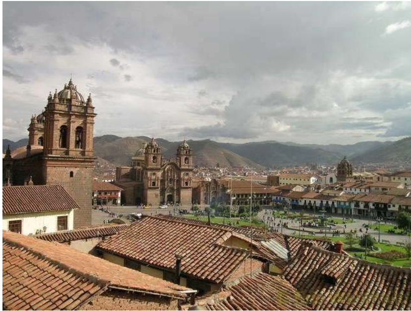
Die Plaza von Cuzco