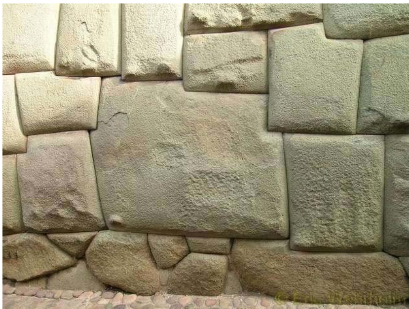
Der Zwölfeckenstein in einer alten Inkawand in Cuzco