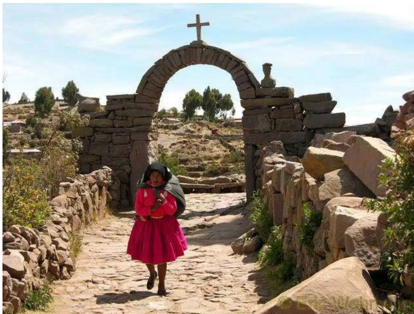
Einheimische Frau auf Taquile

Wieder richtig los, per Rad, ging es dann am 28.10.2006 und die ersten Meter forderten dann auch gleich mal vollen Einsatz von uns. Aus der Stadt heraus ging es sofort steil bergauf. Ein kleiner Pass, mit ca. 400 bis 500 Höhenmetern, musste regelrecht bezwungen werden. Es wurde eine gute Quälerei, denn nicht nur das die Luft extrem dünn war, Puno liegt auf einer Höhe von 3800 m, nein, auch die vorbeifahrenden LKWs und Kleinbusse reicherten das bisschen Atemluft noch gut mit dicken schwarzen Rauchschwaden und Rußpartikeln an. Gut ausgelaugt nach diesem kurzen Aufstieg hielten wir oben an, erholten uns von dem Aufstieg und schauten und genossen ein wenig den Ausblick über die Stadt. Danach ging es zum Glück den Rest der Strecke bergab bzw. flach weiter bis Juliaca.