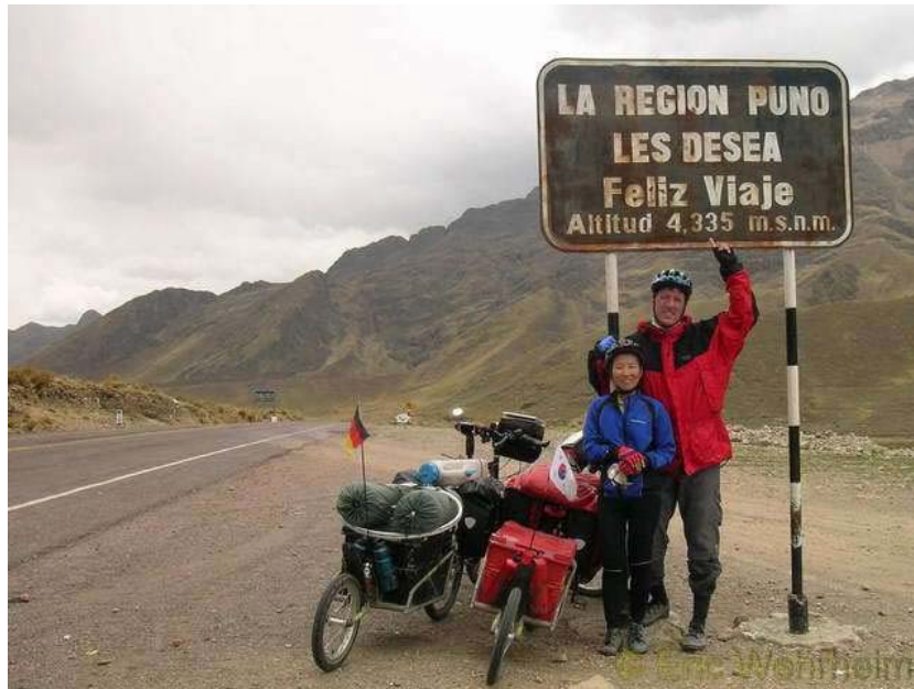
Der Pass ist geschafft

Also fuhren wir schnell weiter, bzw. rollten weiter, denn jetzt ging es ja gut den Berg runter. Bis Sicuani kamen wir so an diesem Tag, einer Tagesetappe von gut 70 km. Am nächsten Tag, besuchten wir kurz nach Sicuani den Ort Raqchi mit einer großen Inka Tempelanlage (Templo de Viracocha). Danach so hatte man uns zuvor versichert, sollte es bis Cusco angeblich nur noch bergab gehen. Doch es trat das ein, was zuvor auf der Reise schon so oft eingetreten ist. Diese angeblich Bergabstrecke entpuppte sich mehr als „up and down“ (hoch und runter) Strecke, als Bergabstrecke. Zudem bzw. leider mal wieder, herrschte ein kräftiger Gegenwind vor und auch Petrus hatte an diesem Tage kein Einsehen mit uns, denn er schickte uns ein paar heftige Regengüsse entgegen. Auch fanden wir in den Orten zwischendrin auf der Strecke keine Herberge, so dass wir bis nach Urcos weiterfahren mussten. Das bedeutete für diesen Tag eine Strecke von ca. 100 km und zu allen Unglück kamen wir so in die Nacht hinein und kurz vor Urcos musste zudem noch ein ziemlich steiler Aufstieg bewältigt werden. Das die Strecke am nächsten Tag dann nur noch knapp 50 km sein würde, interessierte uns an diesem Tag reichlich wenig. Völlig ermattet ließen wir uns in die Betten fallen.