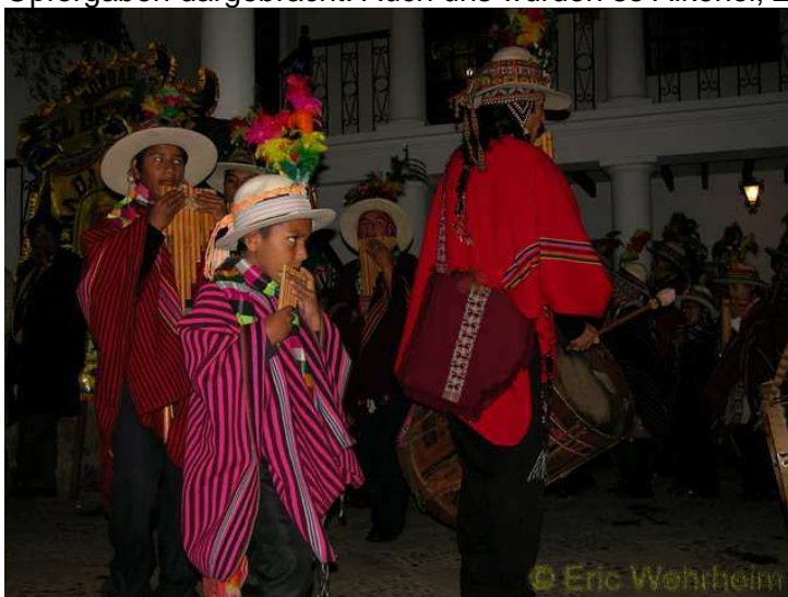
Vorfeier für das Fest der Virgen de Guadalupe

Die letzten Wochen hatte ich schon in Santa Cruz nicht so viel Schlaf abbekommen, da hier in der Nachbarschaft ständig die ganze Nacht durch lautstark gefeiert worden ist und nun in Sucre quälte mich die zu weiche Schaumstoffmatratze des Hotels. Das für mich die Betten in 99,9% der Fälle hier sowieso zu kurz sind, damit habe ich mich ja schon längst abgefunden (die Beine hängen dann halt einfach unten raus), aber dazu auch noch durchgebogen schlafen, dass war dann doch zuviel des Guten. Also haben wir nach zwei Nächten das Lager gewechselt. Zum Glück aber hat die Stadt zum Ausgleich auch kulinarische Angebote, welche die erlittenen Strapazen anderweitig ein wenig wieder ausbügeln. Am Samstag Abend waren wir so auf dem Weg zum Schweizer Restaurant, um Fondue zu essen. Da hörten wir auf dem Weg zum Restaurant im Vorbeigehen aus einem Innenhof schöne Folkloremusik drängen. Heimlich lauschten wir am Tor ein wenig der Musik, denn wir waren der Auffassung, es handle sich um eine private Feier. Die Leute, die im Innhof saßen gaben uns jedoch zu verstehen, dass wir gerne eintreten dürfen, was wir natürlich prompt auch annehmen. Sehr erfreut genossen wir das Spektakel, denn in dem kleinen Innenhof machte eine Gruppe von über 20 Personen Musik. Auch wurden einer Heiligenstatue, welche in einer Ecke des Innenhofes aufgebahrt war, Opfertgaben dargebracht. Auch uns wurden so Alkohol, Zigaretten und Cocablätter dargeboten.