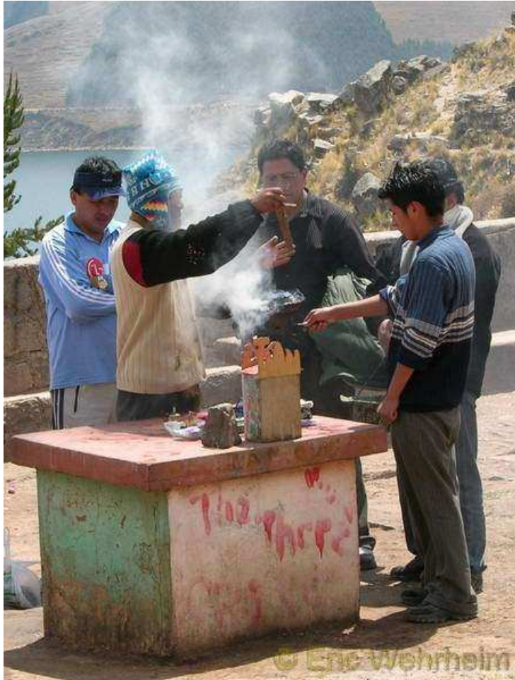
Traditionelle Rituale am Berg in Copacabana

Kopfschmerzen danieder. So haben wir dann auch keinen Ausflug zur Isla del Sol unternehmen können oder wollen, denn die Kraft und somit auch Lust dazu war einfach nicht vorhanden.