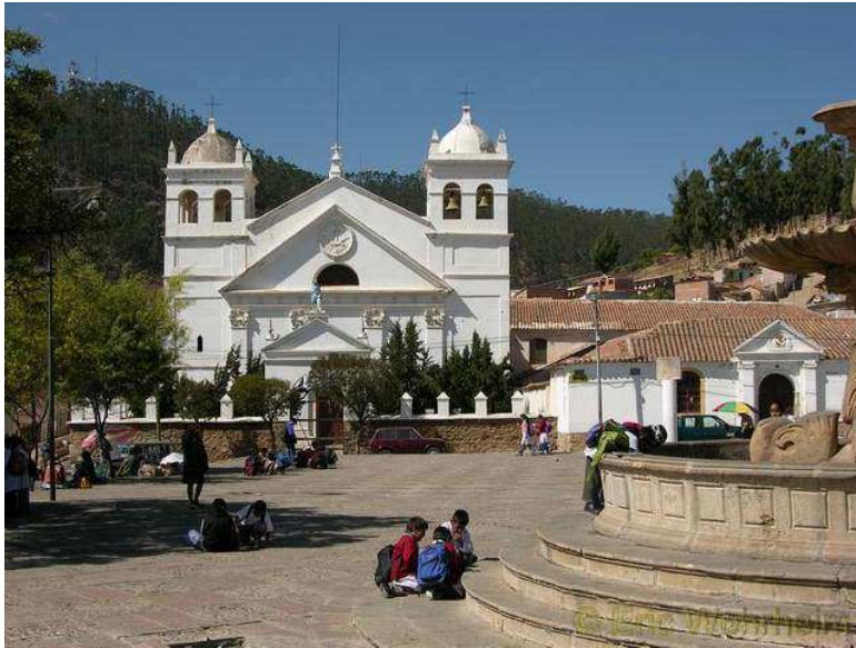
La Recoleta in Sucre

Nach Sucre haben wir uns am 22.09. auf den Weg nach Copacabana gemacht. Nein nicht nach Brasilien, sondern zum gleichnamigen Ort in Bolivien, am Titicacasee gelegen. Dem vorausgegangen war erst mal eine lange und bitterkalte Nachtfahrt in einem unbequemen Bus bis La Paz. Hier kamen wir um 05:30 Uhr morgens an. Eigentlich wollten wir unser Stammhotel in La Paz, gleich neben dem Busterminal aufsuchen, doch man wimmelte uns über die Sprechanlage ab, mit der Aussage, alle Zimmer seien besetzt. Bestimmt gab es noch freie Zimmer, doch der Nachtwächter hatte wohl keine Lust dazu, uns in eines einzutragen. Durch die Stadt wollten wir jedoch so früh morgens und bei der Kälte, es waren so glaube ich um die +5°C., auch nicht rumlaufen, so dass wir wieder zum Busbahnhof zurückgingen, um uns dort ein wenig hinzusetzen und vor der Kälte ein wenig geschützt zu sein.