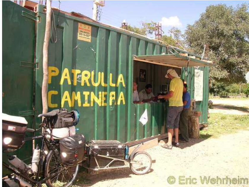
das erste Mal wo ein Polizeiposten unsere Papiere kontrolliert hat

so fort. Etwas geplättet erreichten wir endlich am späten Nachmittag Camiri. Um in den Ort einzufahren durften wir aber erst einmal die mühsam noch beisammen gehalten Höhenmeter wieder abbauen, denn die Stadt lag abseits der Strecke, steil bergab einem Seitental zugewendet. Zu unserer Freude galt es dann, am darauffolgenden Tag dies wieder auszugleichen.