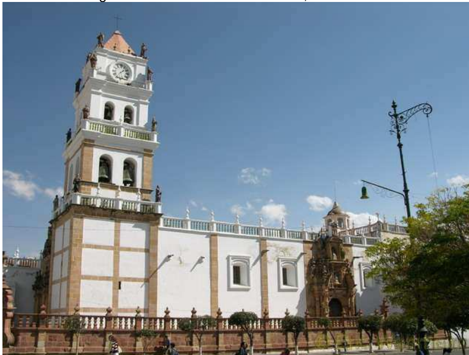
Die Kathedrale von Sucre