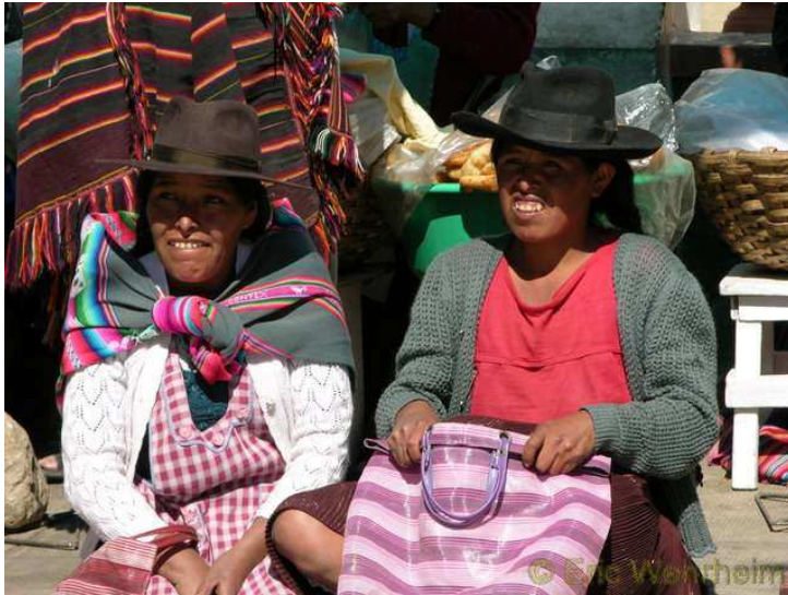
Dorfschönheiten auf dem Markt in Tarabuco

Die letzten Wochen hatte ich schon in Santa Cruz nicht so viel Schlaf abbekommen, da hier in der Nachbarschaft ständig die ganze Nacht durch lautstark gefeiert worden ist und nun in Sucre quälte mich die zu weiche Schaumstoffmatratze des Hotels. Das für mich die Betten in 99,9% der Fälle hier sowieso zu kurz sind, damit habe ich mich ja schon längst abgefunden (die Beine hängen dann halt einfach unten raus), aber dazu auch noch durchgebogen schlafen, dass war dann doch zuviel des Guten. Also haben wir nach zwei Nächten das Lager gewechselt. Zum Glück aber hat die Stadt zum Ausgleich auch kulinarische Angebote, welche die erlittenen Strapazen anderweitig ein wenig wieder ausbügeln. Am Samstag Abend waren wir so auf dem Weg zum Schweizer Restaurant, um Fondue zu essen. Da hörten wir auf dem Weg zum Restaurant im Vorbeigehen aus einem Innenhof schöne Folkloremusik drängen. Heimlich lauschten wir am Tor ein wenig der Musik, denn wir waren der Auffassung, es handle sich um eine private Feier. Die Leute, die im Innhof saßen gaben uns jedoch zu verstehen, dass wir gerne eintreten dürfen, was wir natürlich prompt auch annehmen. Sehr erfreut genossen wir das Spektakel, denn in dem kleinen Innenhof machte eine Gruppe von über 20 Personen Musik. Auch wurden einer Heiligenstatue, welche in einer Ecke des Innenhofes aufgebahrt war, Opfertgaben dargebracht. Auch uns wurden so Alkohol, Zigaretten und Cocablätter dargeboten.