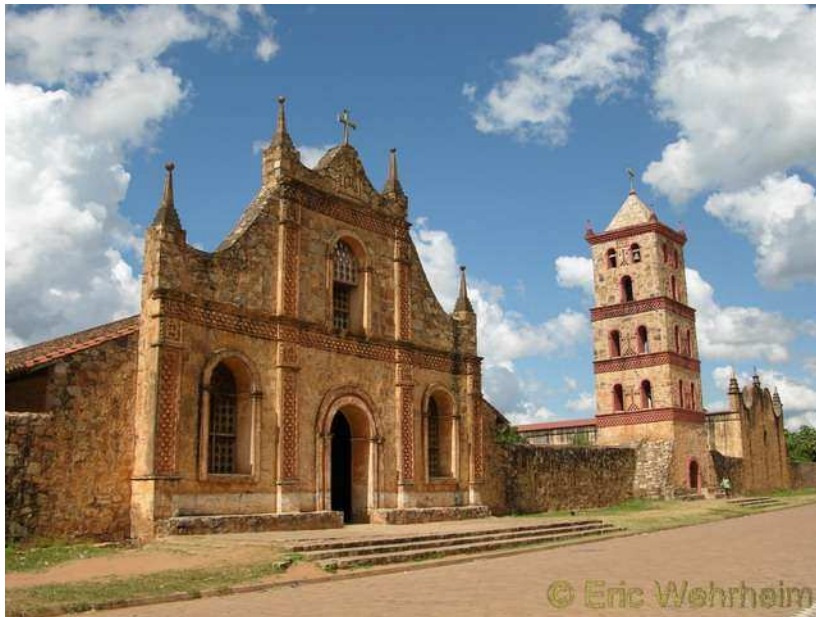
Jesuitenkirche in San Jose de Chiquitos