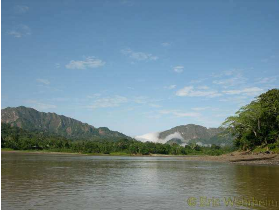
Rurrenabaque - das Tor zum Amazonas

aber, um nicht noch ein tieferes Loch in unser Budget zu reisen, dann doch mit dem Bus angetreten. Man glaubt gar nicht wie staubig so ein subtropisch feuchtes Gebiet sein kann. Zuerst hatten wir von Guayaramerim nach nur 5 Stunden Busfahrt einen Zwischenstopp in Riberalta eingelegt, doch am darauf folgenden Tag saßen wir bereits wieder über 16 Stunden im Bus, bis wir in Rurrenabaque ankamen. Wirklich, soviel Staub haben wir beide bestimmt zuvor in unserem ganzen Leben noch nicht geschluckt. Da weiß man doch was man an asphaltierten Strassen hat.