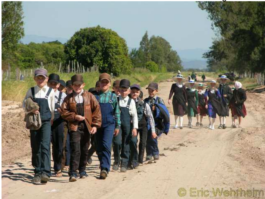
Blond und blauäugig, die Menoniten(kinder) in der Nähe von Santa Cruz