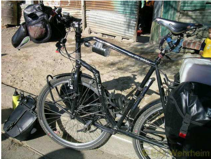
Mein Fahrrad - etwas geknickt

Fangen wir aber erst mal von vorne an. Nach über 3 Monaten des Nicht-Radfahrens saßen wir endlich wieder am 08.08.2006 im Sattel. Es ist uns schwergefallen, nach so langer Zeit des Verweilens uns wieder in den Sattel zu schwingen. Gut, so müßig sind wir in dieser Zeit ja auch nicht gewesen und haben fast das ganze Land per Bus erkundet, doch unsere Hinterteile und Beinmuskulaturen meldeten sich nach ein paar Kilometern sofort und beschwerten sich. Die Ausfahrt aus Santa Cruz war auch, obwohl total flach, alles andere als einfach. Es wehte ein heftiger Wind aus Norden, leider wie so üblich für uns aus der entgegengesetzten Richtung, der zu allem Übel auch immens viel aufgewirbelten Sand mit sich führte, so dass unsere Haut kräftigst sandgestrahlt wurde. Nach 30 km war zum Glück diese Tortour überstanden und wir machten uns auf die Suche nach einem Nachtquartier, doch als wir unsere Gesichter ansahen trauten wir uns nicht, so wie wir aussahen, in ein Hotel oder Hostal einzutreten. Total verdeckt durch die Erd- und Sandduschen von der Tour sahen unsere Gesichter fast schwarz aus. Eine Nottoilette war also erst mal angesagt und viel Toilettenpapier, unser Taschentuchpapierersatz, musste dafür herhalten.