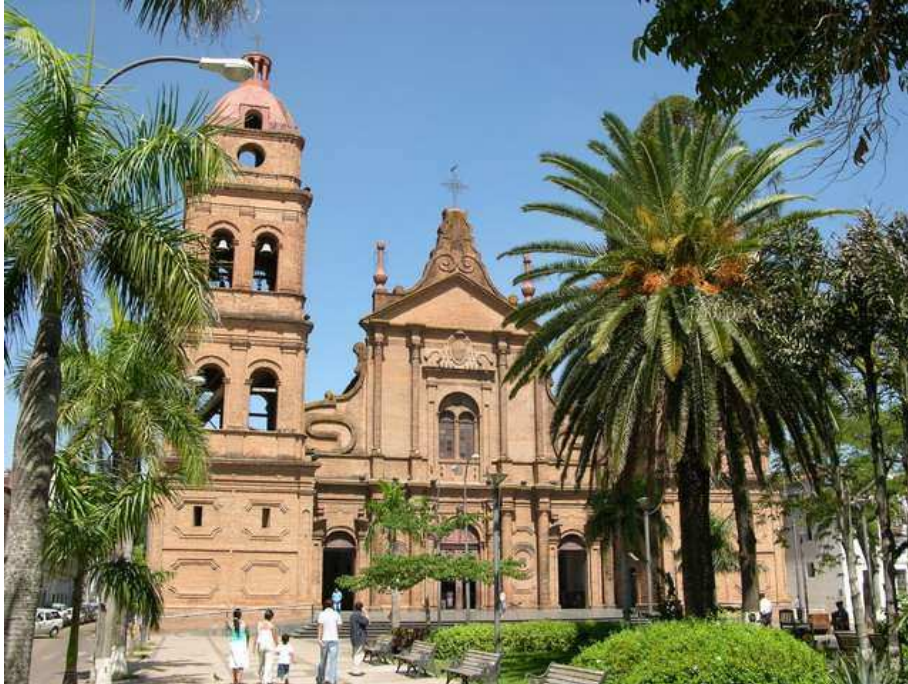
Die Kathedrale von Santa Cruz

Zwei Zwischenstops gab es aber noch, einer in Abapó, einem kleinen Ort direkt nach am Flussübergang des Rio Grande (auch Rio Guapay genannt) und danach noch einmal, kurz vor Zanja Onda, auf einer kleinen Milchfarm. Es war nämlich so, dass es auf dem weiteren Strecke nach Santa Cruz, ca. 70 km, keinen nennenswerten Ort mehr gab, in welchem man eine Übernachtungsmöglichkeit hätte finden können. Wild zelten war auch kaum möglich, da alles entweder eingezäunt war oder kaum zugänglich. So hielten wir kurzer Hand bei einem Grundstück an, welches einladen aussah und wo auf der Eingangspforte auch noch "Bienvenidos" (herzlich willkommen) stand. Wir fragten den Besitzer ob wir auf seinem Land zelten durften und dieser, zuerst etwas verblüfft über unser Anliegen, willigte dann dazu ein. Unter einem Vordach konnten wir unser Zelt aufschlagen und die frische Landluft genießen. Am nächsten Morgen jedoch, es sind halt nicht alle so gute Langschläfer wie wir, war es ab 05:00 Uhr früh (ist doch noch mitten in der Nacht, oder nicht?) mit der Nachtruhe vorbei. Die Kühe wurden gemolken und das Radio der Arbeiter hierzu voll aufgedreht. Ce la vie. So konnten wir, um kurz nach sieben, wohl unsere frühest begonnene Tagesetappe antreten.