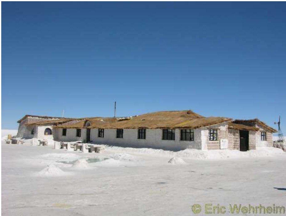
Das Salzhotel auf dem Salar de Uyuni

Uyuni als Stadt bietet kaum etwas. Dafür ist dieser Ort aber das „Gateway“ zum Salar und demzufolge mit unzähligen Tourveranstalterbüros übersät. Auch wir haben uns einem solchen Veranstalter, nach etlichen hin und her Suchen, anvertraut. Wir haben extra nicht den billigsten genommen, in der Hoffnung so ein zuverlässigeres Unternehmen gefunden zu haben, doch auf Tour war unser Auto dasjenige, was zuerst auf der Strecke liegen geblieben ist. Zum Glück war es aber keine tragische Sache und unser Fahrer hatte den Jeep nach einer halben Stunden wieder flott. Zu acht saßen wir in dem Toyota Landcruiser, sechs Touristen samt Fahrer und Köchin. Drei Tage hatten wir gebucht, um den Salar zu befahren und die Laguna Colorado und Laguna Verde zu besuchen. Auch wenn das Ganze eine ziemlich harte und extreme Tour war, etliche hundert Kilometern mussten eingepfercht in dem Jeep durch unwegsames Gelände absolviert werden und die Nächte waren bitterkalt (ca. -18°C.), doch gelohnt hat sich dieser Ausflug auf jeden Fall. In Worten kann man diese Landschaft kaum beschreiben, weswegen ich auch erst gar den Versuch dazu unternehmen will. Auch die Fotos, welche ihr hier sehen könnt, geben leider nur einen Teil wieder, was diese Landschaft ausmacht. Somit einfach gesagt: atemberaubend schön.