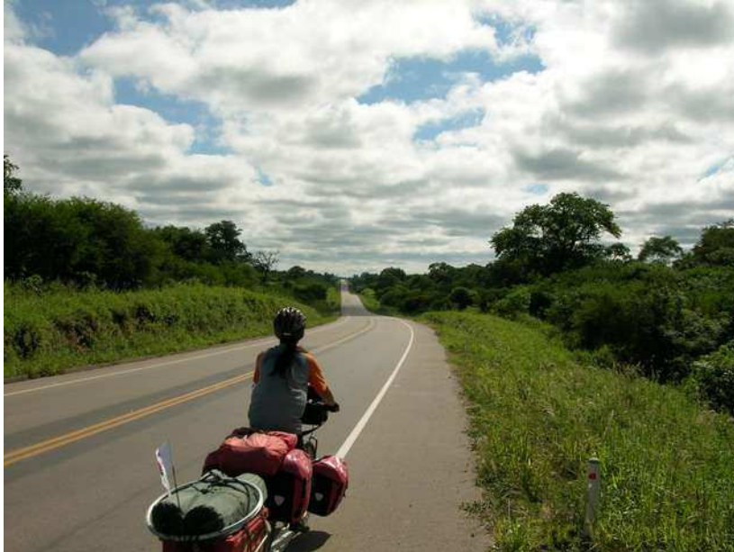
Die ersten Meter in Bolivien durch den Chaco

Am 18.04.2006 fuhren wir bei Yacuiba in Bolivien ein. Unser beider erster Eindruck war, wir haben uns verfahren. ...wir sind wieder in Indien! Kaum haben wir die Grenze passiert, da wimmelt es auch schon überall auf der Strasse von Menschen und rechts und links des Weges säumen unzählige kleinere und größere Geschäfte die Straßenfront. Jetzt also waren wir "richtig" in Südamerika! Argentinien und Chile haben dagegen doch schon etwas, pauschal gesagt, europäisch angemutet.