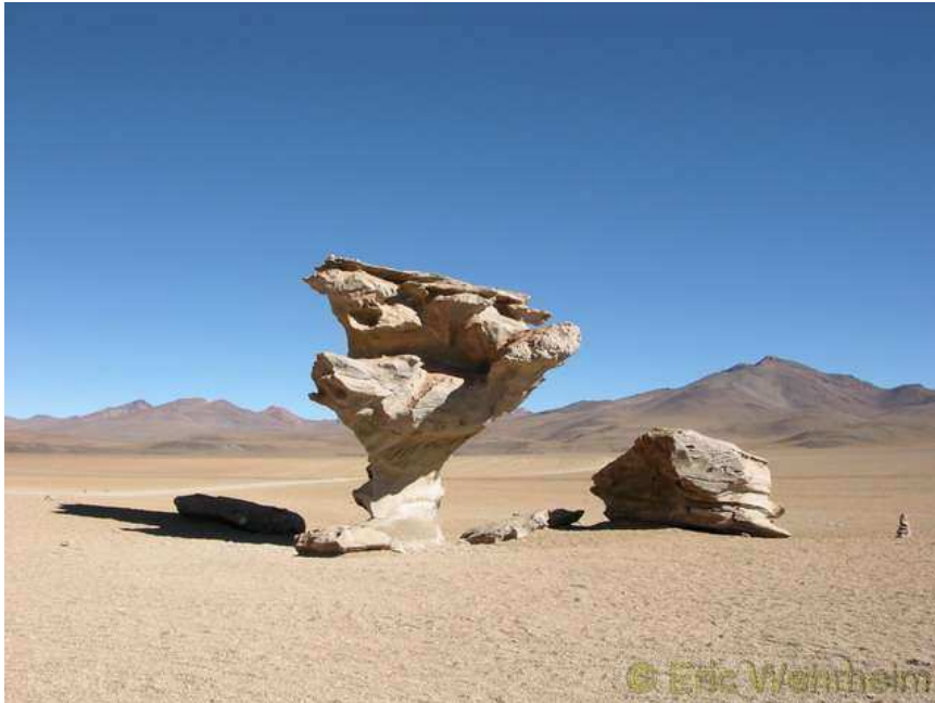
El Arbol de Piedra (Die Steinbaum Skulptur) geformt durch den Wind

Gut durchgefroren sind wir am 17.06. wieder in Uyuni zurück angekommen und am darauf folgenden Tag mit dem Bus nach Sucre, zum Rückweg nach Santa Cruz, aufgebrochen. Hier bei der Abfahrt in Uyuni passierte es dann, wovon man überall gewarnt wird: wir wurden um unsere Videokamera erleichtert. Von anderen hörte man das schon allzu oft, doch selbst hatte man das Gefühl, dass so etwas einem selbst nicht passieren kann. Und dann einen Augenblick der Unachtsamkeit nur und weg ist das Gute Stück. Alle Maßnahmen, die Kamera wieder aufzutreiben, wie z.B. eine Durchsuchung des Busses oder Anzeige bei der Polizei, haben natürlich nichts gebracht. Ce la vie, weg ist weg.