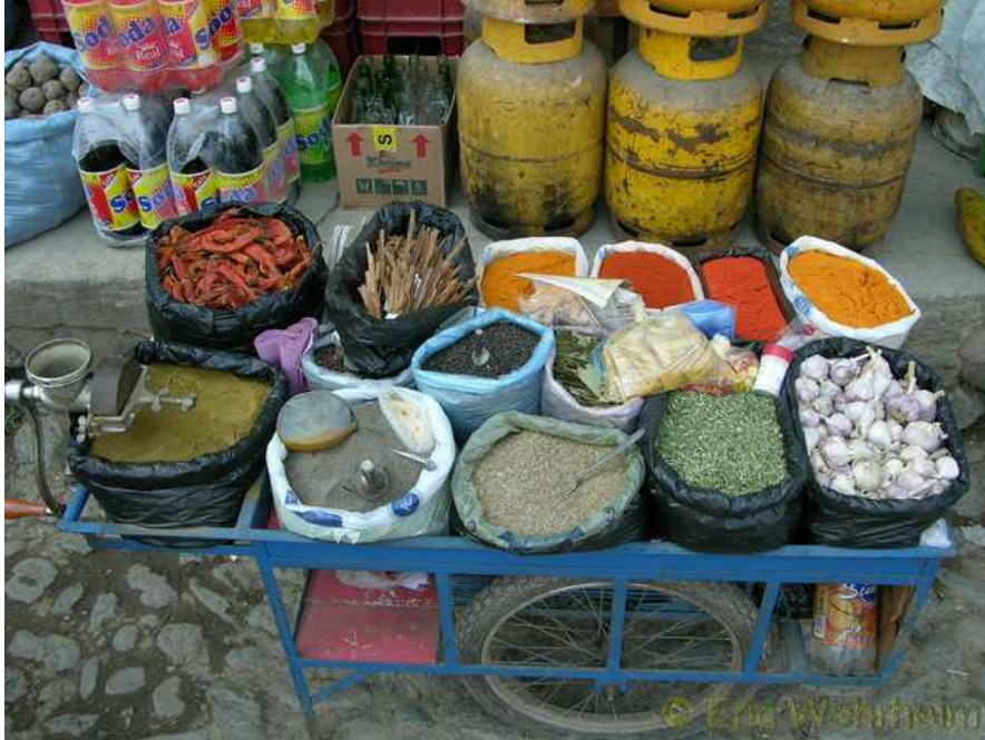
Gewürzstand in den Strassen von Coroico

tief direkt nach unten in den Abgrund sehen. Straßensicherung? Fehlanzeige, die ganze Strecke ist bis kurz vor La Paz Schotter- und Staubbahn. An ganz uneinsichtigen längeren Strecken gibt es dann aber Straßenposten, ausgestattet mit grünen und roten Fahnen. Man kann da dann nur hoffen, dass die sich mit den Farben nicht vertun.