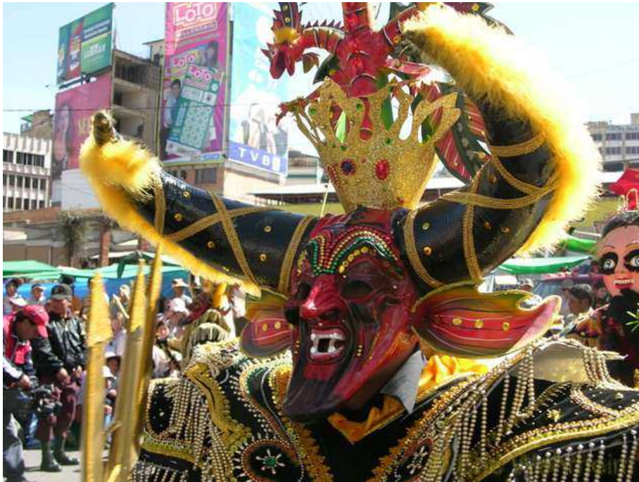
Tänzer auf dem Fest "El Gran Poder"

Wir hatten uns bereits unsere Weiterfahrtickets nach Uyuni gekauft, denn der Salar de Uyuni stand nun auf dem Programm, da erfuhren wir, dass in zwei Tagen in La Paz ein großes Folklorefest stattfinden sollte. La Paz ist aber von Potosí ne gute Ecke weit entfernt und den Salar wollten wir auf jeden Fall besuchen. Was also tun? Nun, wir haben uns gesagt, dass wir dafür nun mal auf Reisen sind, um solche Dinge wahrzunehmen und somit haben wir kurzer Hand die Tickets gewechselt und sind so am darauf folgenden Tag nach La Paz aufgebrochen. Die ganze Nacht sind wir durchgefahren und am Samstag den 10.06. um 05:00 Uhr in La Paz angekommen und um 07:00 Uhr ging bereits das Fest los, welches sich komplett durch die ganze Stadt zog. El Gran Poder heißt das Fest, welches eines der größten und wichtigsten Festlichkeiten der Stadt darstellt.