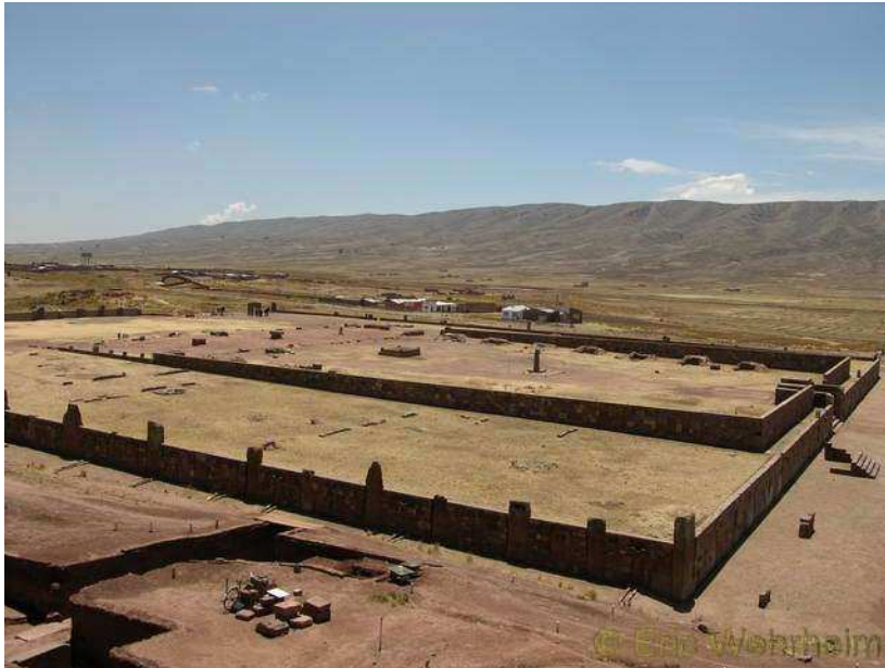
Ein Teil der Anlage von Tihuanaco

So saßen wir also doppelt fest. Jeden Tag waren wir morgens und nachmittags im Busterminal, um zu sehen ob irgend etwas wieder voranging, doch ohne Erfolg. Am dritten Tag sagte man uns sogar, nachdem eigentlich tags zuvor es so aussah, dass die Blockaden aufgehoben werden sollten, dass nun die Straßenblockade sogar noch schlimmer sein sollen, da sich nun die Mineros (Minenarbeiter) sogar mit Dynamit bewaffnet hätten sollen. Unsere Eile war zwar nicht ganz so groß, denn erwartungsgemäß mahlen die Mühlen hier langsamer und die angegebenen 4 bis 6 Tage Lieferzeit des Paketes waren m.E. sowieso zu optimistisch (10 bis 14 Tage waren da wohl eher realistisch), doch ohne zu wissen wann man weiterkommen kann, ist auch diese Situation ohne Zeitstress ziemlich nervig. Am 5.Tag jedoch war die Blockade, so schnell wie sie gekommen war, dann auch wieder verschwunden. Schnell packten wir daher unsere Habseligkeiten zusammen und nahmen den nächstmöglichen Bus, denn man kann ja nie wissen.