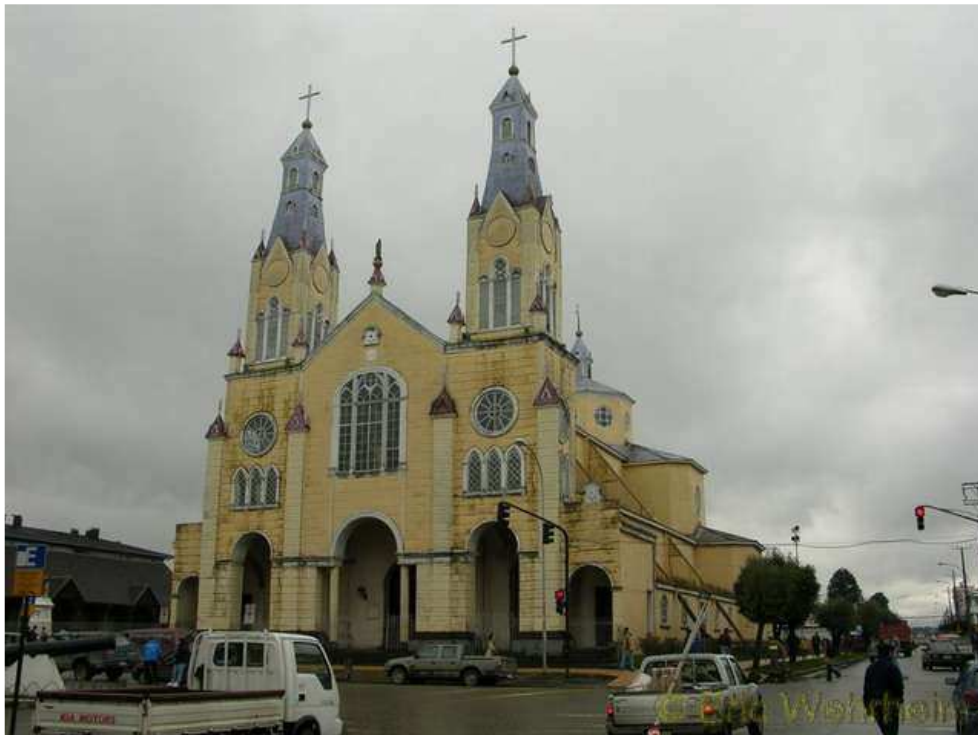
가스트로의 나무 성당

성당Cathedral: 가스트로에는 외형 및 내부가 모두 나무로 지어진 성당Cathedral이 있는데 볼만한 건축물이다. 1906년 이태리 건축가 Eduard Provosoli가 설계하여 오렌지와 보라색의 색상으로 지어짐, 지금은 색이 바라서 오렌지색이 노란색으로 보이지만 해가 날 때 자세히 보면 보라색과 오렌지색이 혼합되어 미묘한 분위기를 연출한다.