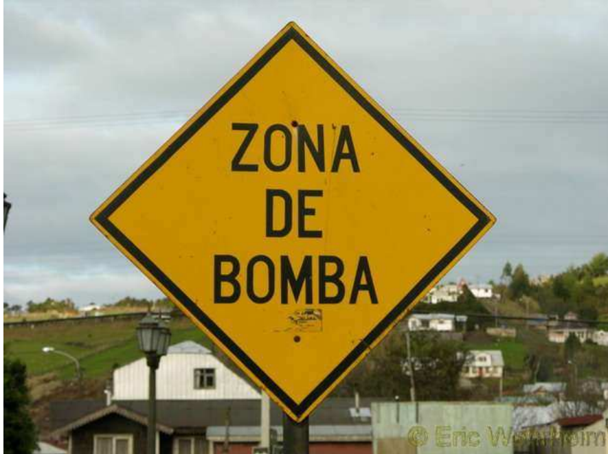
위험한 칠레의 도로 표지판

가수엘라 국을(칠레의 전통 국 요리. 우리나라 육개장과 같은 맛이며 고기 덩어리에 감자, 옥수수, 쌀이 함께 들어가서 우리 입맛에 잘 맞다.) 먹고 나니 힘이 펄펄 난다. 국경도 잘 넘었고 첫 인상도 좋고 칠레 여행이 아주 순조로울 것 같은 예감이다.