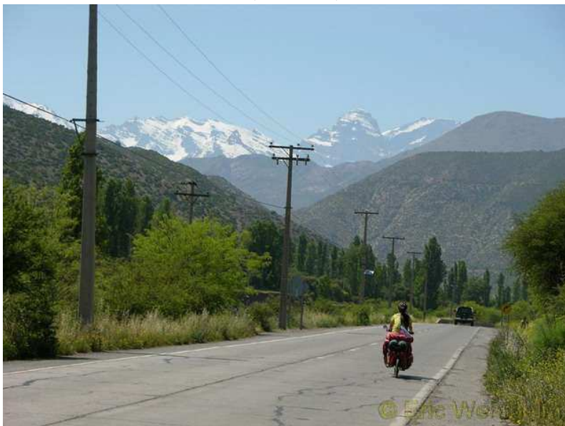
안데스 산맥이 기다린다

이틀 쉬면서 자전거 정비하고 안데스 산맥을 올라갈 준비를 해야 했다. 한편으로 안데스 산맥을 또 올라 갈 수 있다는 환희, 한편으로는 너무 힘들 것 같은 두려움이 앞선다. 이번에는 3189m 높이라는데 지난번 아르헨티나에서 칠레로 넘어온 안데스 높이의 두 배는 되니 걱정이 안 될 수 없다. 에릭은 미리 몸보신을 해야 한다며 이틀 동안 고기를 1킬로그램은 넘게 먹고 몸을 만들었는데 글썽 정상 쪽에는 ‘산소도 희박하다’고 하는데 고기를 많이 먹었다고 과연 잘 오를 수 있을까? 걱정, 두려움, 기대가 서로 교차한다.