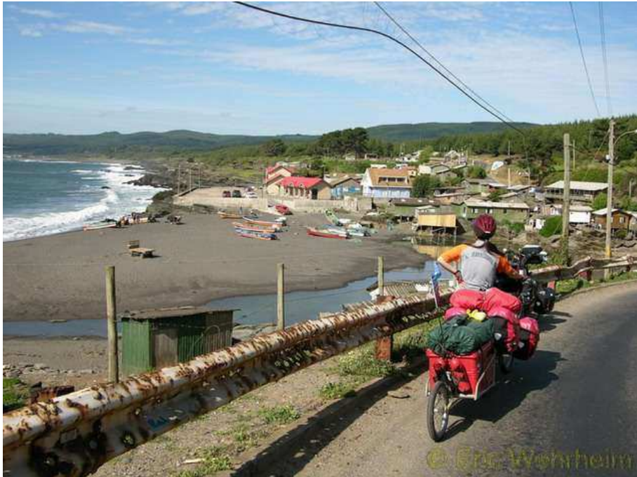
경사가 많은 해변가