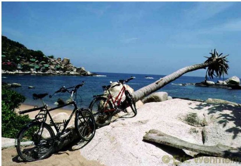
Auf Koh Tau

Auch stand wieder ein Inselhopping an, den Koh Tau, Koh Phangna und Koh Samui standen auf unserer Route.