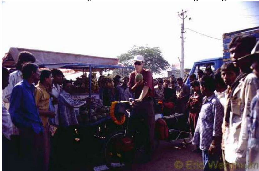
Immer eine Attraktion wert

Die Tränen waren längst getrocknet, der Transport und das anschließende Einchecken in Nairobi verlief ohne Komplikationen und wir landeten früh Morgens gut in Mumbai. Mit dem Taxi, alle beiden Fahrräder samt Gepäck und Anhänger sowie uns beiden wurden von einem Auto der Größe eines Trabbi transportiert, fuhren wir in die Innenstadt und in der Nähe des Bombaygate, fanden wir Quartier. Wieder einmal war der Sprung gewaltig. Alles war anders als zuvor. Tolle und auch nicht so tolle Gerüche flogen einem an der Nase vorbei. Es war Anfang Dezember 1998. Drei Monate bewegten wir uns anschließend mit unseren Rädern durch Indien, diesem total andersartigen Land und überall wo wir anhielten umlagerte uns ein Menschenschwarm und schaute wie gebannt auf uns unsere eigenartigen Sachen.