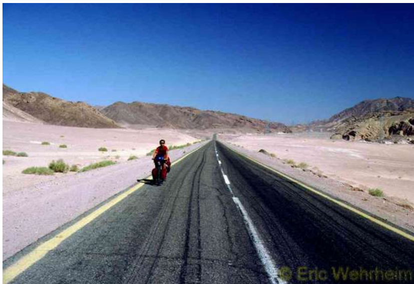
Auf dem Weg zum Toten Meer

Nach Tel Aviv ging es landeinwärts hinauf nach Jerusalem, einem Geschichts- und Kulturkonglomerat was einzigartig auf der Welt ist. Nachdem wir uns dort dem Treiben ein wenig hingegeben hatten, ging tief runter zum tiefsten Punkt auf der Erdoberfläche, dem Toten Meer.