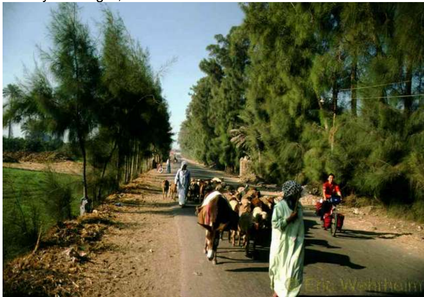
Unterwegs in Ägypten

Bei über 50°C durchradelten wir dann den Sinai und folgten dem Roten Meer. Hier machten wir auch Bekanntschaft mit Steine werfenden Kindern. Seitens unseres Reiseführers war uns diese Problematik jedoch bekannt, so dass wir Vorsorge treffen konnten und selbst ein paar Steine werfbereit dabei hatten. Nachdem wir aber den Kindern zu verstehen gegeben hatten, dass, wenn sie Steine werfen, wir durchaus auch dazu in der Lage sind, konnten wir die meisten Stellen meistens unbehelligt passieren. Eine schon ziemlich paradoxe Situation, doch irgendwie finden es die Kinder so eigenartig das ein Westeuropäer auf einem Fahrrad durch ihr Land kommt, dass sie auf ihn mit Steinen werfen. Nach dieser Episode landeten wir in Kairo, in diesem Trubel aus 1000 und 1 Nacht. Hier wurde auf uns zwar nicht mit Steinen geworfen, doch versuchte nun alle fünf Meter irgendjemand, uns zu irgendwelchen Geschäften und Einkäufen zu animieren. Oder, hatte man die Verkäufer abgewimmelt, dann kam jemand und hatte eine herzerweichende Story auf Lager, um so vielleicht an etwas von unseren Finanzen zu kommen.