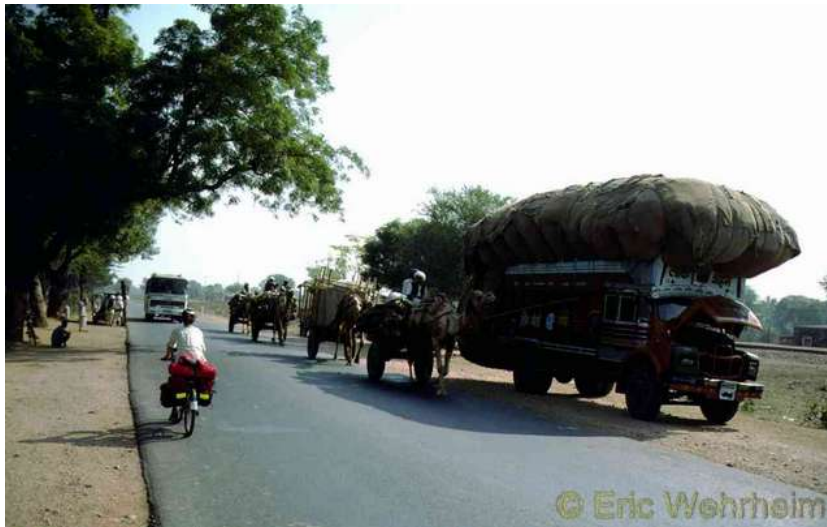
Die üblichen Verkehrsmittel in Indien

Weihnachten und Sylvester verbrachten wir ohne zu feiern für uns allein, denn das Land kennt diese Bräuche nicht. Wir passierten, Udaipur u.a. bekannt durch eine James Bond Film Pussycat (dieser Film wird dort überall zum Abendessen als Video gezeigt), Agra, natürlich weltweit bekannt durch das traumhaft schöne Taj Mahal und Jaipur, bekannt wegen seinem Palast der Winde (welches jedoch eine reine Fassadenarchitektur ist und nur den Sinn hatte, den Frauen des Maharadscha, es müssen schon etliche gewesen sein, einen geschützten Blick feilzubieten, um die stattfindenden Umzüge mitverfolgen zu können). Nach drei Monaten dann gelangten wir nach Kalkutta und uns war es genug mit den Gerüchen und dem Schmutz, welche wir allerorten frei sahen und riechen konnten.