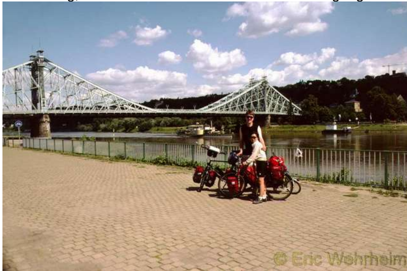
An der Elbe entlang

Gestartet sind wir in Hamburg, ohne zuvor trainiert zu haben oder mit der kompletten Ausrüstung einmal Probe zu fahren. Die ersten Meter durch die Stadt waren daher ein wenig eirig und gewöhnungsbedürftig, doch zum Glück war der Einstieg äußerst entgegenkommend. Es ging stracks an der Elbe entlang, also flach und ohne nennenswerte Steigungen.