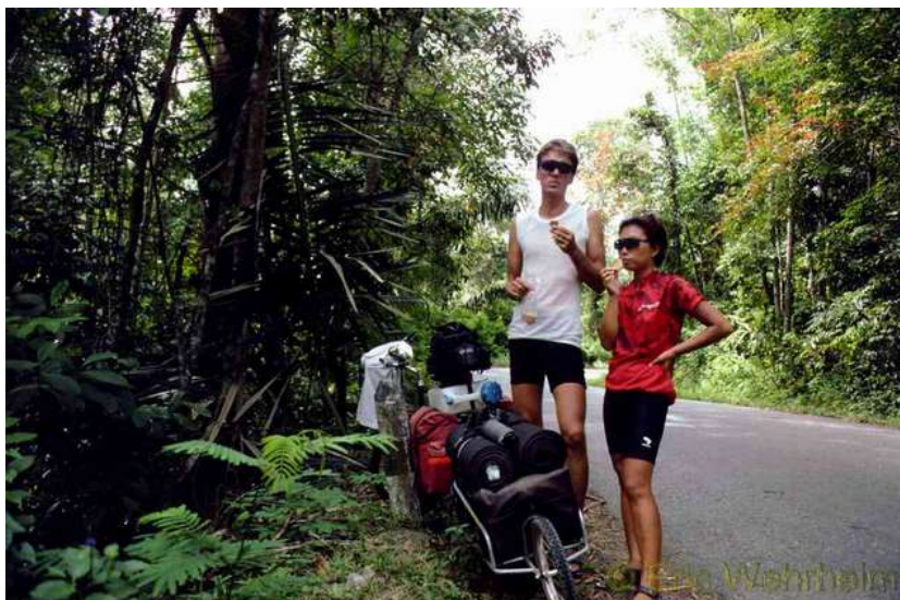
Mittagsrast mit Salzkeksen als Hauptgericht

Doch allein auf Sumatra, der Größten der ganzen Inselgruppe, haben wir uns fast zwei Monate aufgehalten, so dass wir erst mal wieder das Land verlassen mussten, um unser Touristenvisa aufzufrischen. Ein 60 Tage Visa ist halt wirklich mehr als zu wenig für dieses riesige Land. Wir besuchten aber zuvor in Sumatra eine Orang Utan Rehabilitationsstation, die Insel Tuk Tuk, welche in einem riesigen Kratersee liegt und fuhren dann, ziemlich abenteuerlich, mit einem