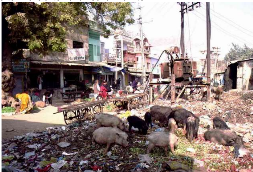
Öffentliche Müllstelle inkl. Schweine

Weihnachten und Sylvester verbrachten wir ohne zu feiern für uns allein, denn das Land kennt diese Bräuche nicht. Wir passierten, Udaipur u.a. bekannt durch eine James Bond Film Pussycat (dieser Film wird dort überall zum Abendessen als Video gezeigt), Agra, natürlich weltweit bekannt durch das traumhaft schöne Taj Mahal und Jaipur, bekannt wegen seinem Palast der Winde (welches jedoch eine reine Fassadenarchitektur ist und nur den Sinn hatte, den Frauen des Maharadscha, es müssen schon etliche gewesen sein, einen geschützten Blick feilzubieten, um die stattfindenden Umzüge mitverfolgen zu können). Nach drei Monaten dann gelangten wir nach Kalkutta und uns war es genug mit den Gerüchen und dem Schmutz, welche wir allerorten frei sahen und riechen konnten.