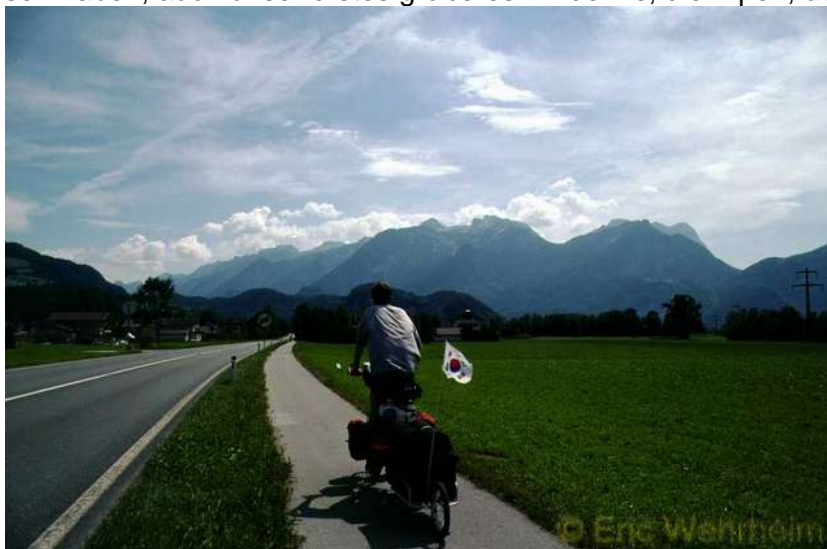
Die Alpen im Visier

Nachdem wir ein paar Wochen unterwegs waren, Deutschland, die Tschechei und Österreich hinter uns gelassen haben, auch unser erstes größeres Hindernis, die Alpen, überquert hatten,