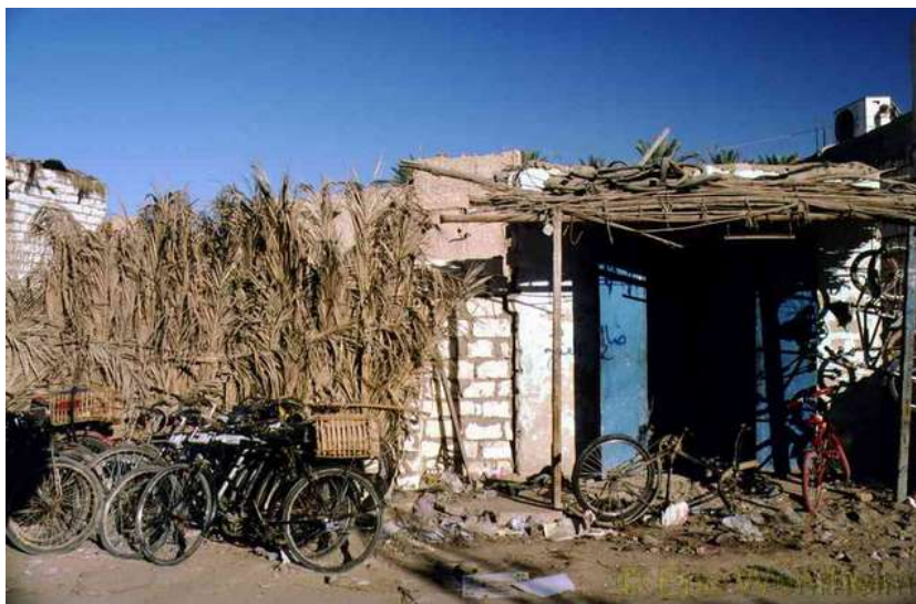
Moderner Fahrradladen in Ägypten

Von Kairo aus unternahmen wir, per Zug und ohne Räder, einen Ausflug nach Luxor zu den Königs- und Königinnengräbern. Zurück ging es auf einer Feluke den Nil hinunter und nachdem wir in Kairo angekommen, verließen wir auch gleich wieder die Stadt, um mit den Rädern einen