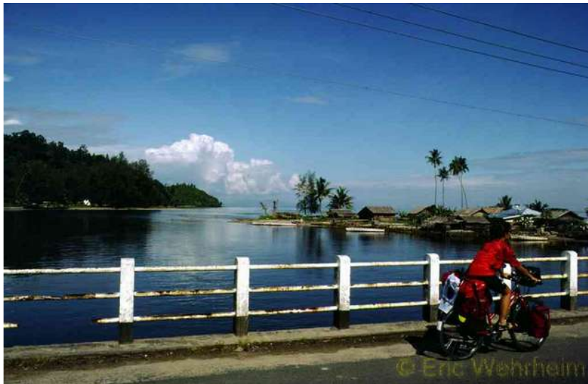
An der der Küste auf Sumatra