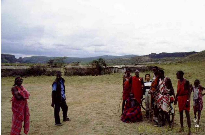
Bei den Masai

Der Sprung von Ägypten nach Kenia war aber gewaltig. Waren wir durch das Reisen mit dem Rad an sanfte Übergänge, landschaftlich und kulturell, gewöhnt, so war hier, durch das Fliegen, der Wechsel frappant. Keine Wüstengebiete mehr, sondern viel Grün und die Menschen nicht mehr hell sonder dunkelhäutig.