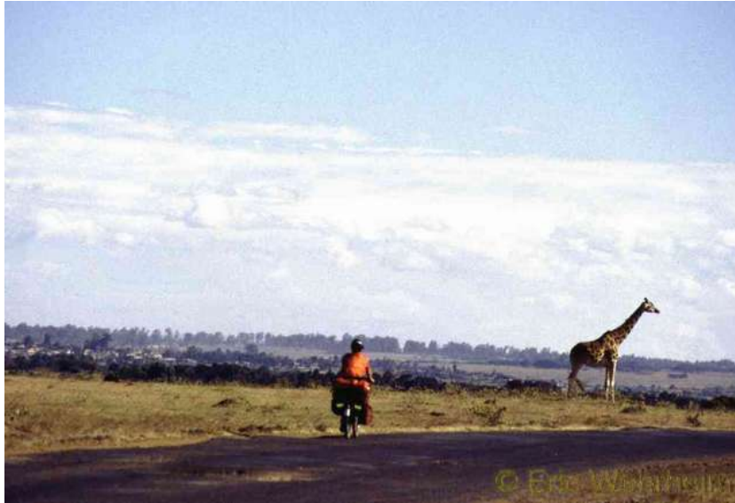
Giraffen an der Strasse

Es geschah sogar, wir zelteten gerade im Nakurunationalpark, dass in einer Vollmondnacht nachts plötzlich sich ein Schatten auf unserem Zelt abzeichnete, der von einem Jaguar oder ähnlich großer Wildkatze her stammte. Nach diesen Wildausflügen begaben wir uns nach Mombasa. Hier wartete jedoch eine Überraschung auf uns, denn wieder einmal war eine Schiffsverbindung wie angedacht nicht möglich. Es gab zwar ausreichend Schiffsverbindungen zwischen Kenia und Indien, wie wir in den Schiffsagenturen in Erfahrung bringen konnten, aber Heuertags werden auf diesen keine Passagiere mehr mitgenommen. Wieder einmal musste umdisponiert werden und wir bestellten mal wieder ein Flugticket gen Indien. Ein paar Tage verbrachten wir noch damit die Küste von Kenia etwas abzufahren, doch dann mussten wir zurück nach Nairobi. Und damit wir nicht die gleiche Strecke zweimal zurücklegen auf dem gleichen Weg, hatten wir uns Zugtickets besorgt. Das verladen in den Zug ist, Dank Unterstützung des Bahnhofchefs, gut abgelaufen und wir konnten zwei Sitzplätze neben unser Gepäck für uns in Beschlag nehmen.